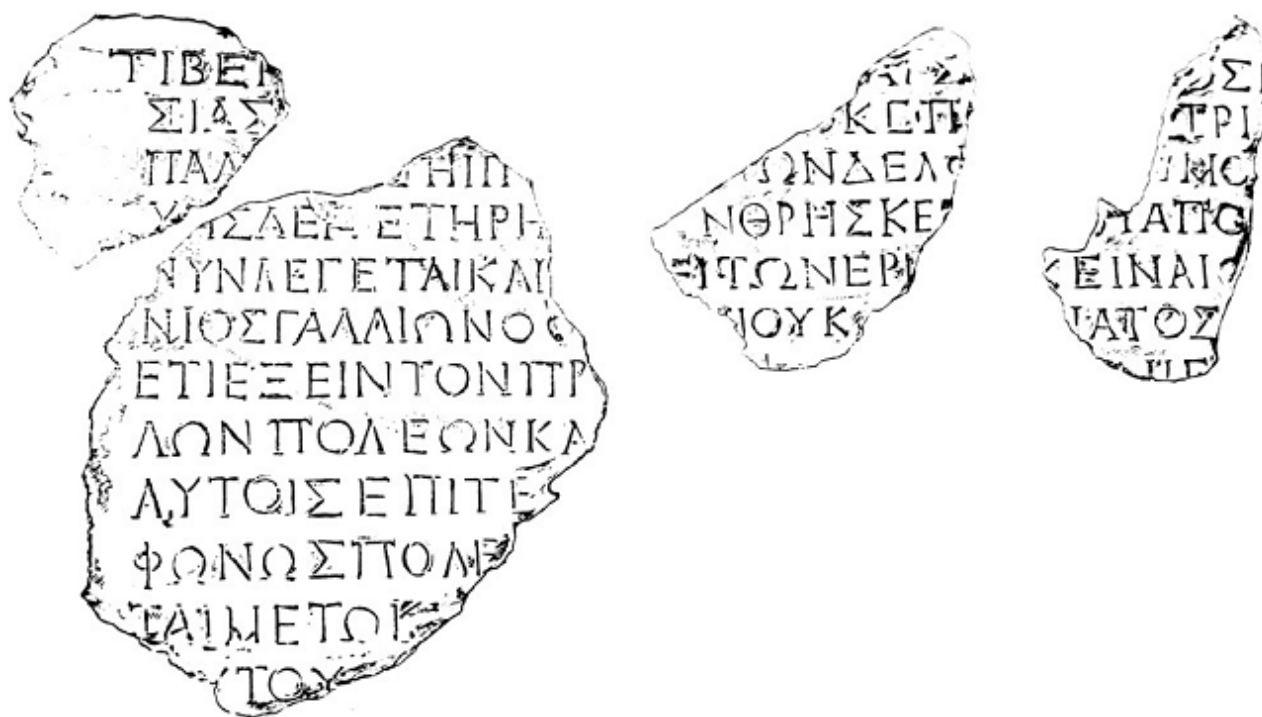
Fig. 2 - Iscrizione delfica: i quattro frammenti superiori nei quali compare il nome di Gallione e la datazione. L'immagine qui sopra riprodotta, come pure quella successiva, è una elaborazione del disegno della iscrizione realizzato da E. Bourguet. Questi frammenti furono accostati e pubblicati per la prima volta da Bourguet nel 1905. Nel 1910 egli ne pubblicò altri tre. Ad A. Plassart si deve l'aggiunta degli ultimi due frammenti e la rivalutazione dell'insieme. ( http://www.glisicritti.it/gallery3/index.php/ )