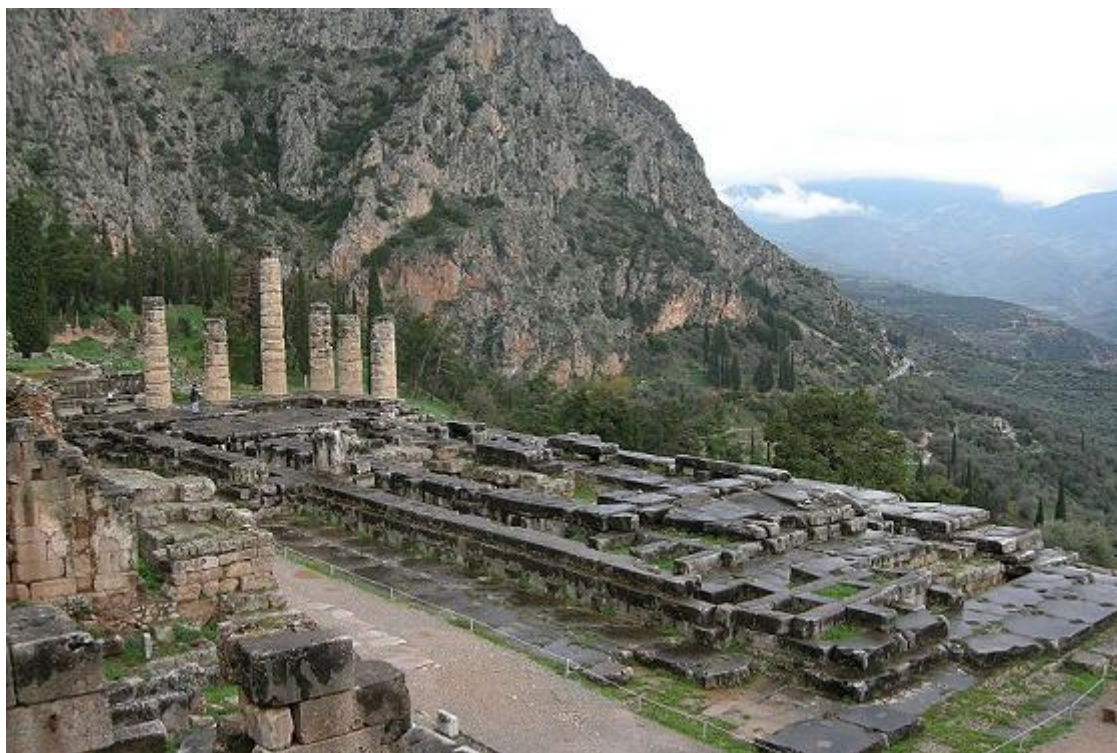
Fig. 1 - Tempio di Apollo a Delfi, Grecia. Il tempio era collocato a 500 metri di altitudine e, in linea d'aria, a 8 km dal Golfo di Corinto; il santuario panellenico di Delfi, di cui il tempio è la principale costruzione, risale all'età micenea. L'esortazione «CONOSCI TE STESSO» (in greco antico: ΓΝΩΘΙ ΣΑΥΤΟΝ) è una massima iscritta nel tempio di Apollo a Delfi, con cui si intimava agli uomini di riconoscere la propria limitatezza e finitezza. (L'uso della immagine non vuole suggerire che il licenziante avalli il presente scritto. Link )

1892 e il 1905 ( Fig. 1 ). Della pietra restano nove frammenti ( Figure 2 e 3 ), ritrovati sulla terrazza del tempio.