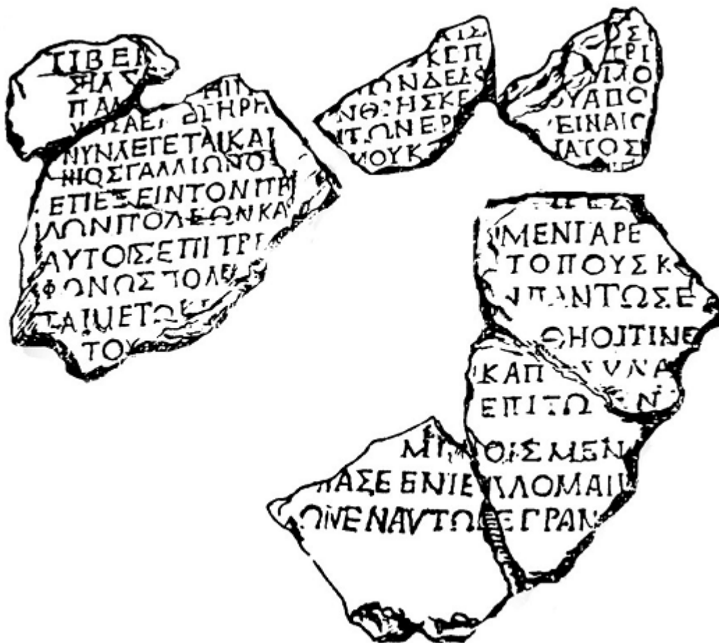
Fig. 3 - Iscrizione delfica: l'immagine mostra i sette frammenti, tra cui i quattro riprodotti nella figura precedente. Ai tre frammenti inferiori se ne aggiunsero successivamente altri due. Le righe dei frammenti inferiori contengono l'ordine imperiale che quanto disposto nella lettera soprascritta non sia disatteso da alcuno. ( http://www.glisicritti.it/gallery3/index.php/ )