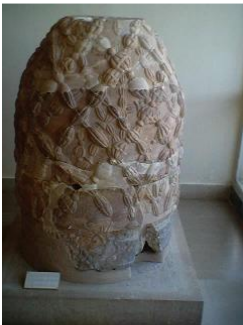
Fig. 5 - Omphalos in Delfi. ( Link )

Fu l'archeologo francese Adolphe Joseph Reinach (1887-1914) a rilevare l'importanza della Iscrizione delfica per la cronologia dell'apostolo Paolo: le date del seguito dei viaggi paolini dipendono da quella del soggiorno a Corinto.