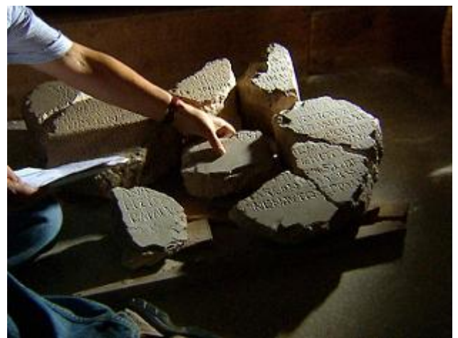
Frammenti della Iscrizione di Delfi .