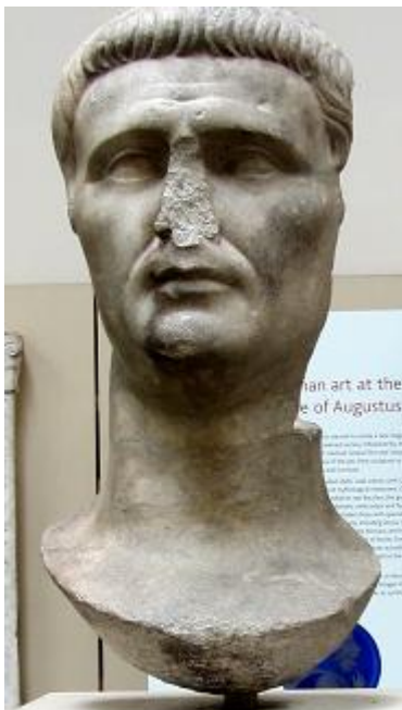
Fig. 4 - Testa marmorea di statua dell'imperatore romano Claudio (circa 50 d.C.), proveniente dal tempio di Athena Poliade a Priene, in Asia Minore. British Museum, Londra.

L' Iscrizione di Delfi è una lettera dell'imperatore Claudio (in carica dal 41 al 54 d.C.) ( Fig. 4 ) indirizzata alla città di Delfi, sede del più importante e venerato oracolo del dio Apollo. Tra i monumenti della città-santuario si ricordano il teatro e lo stadio (in cui ogni quattro anni si svolgevano i giochi pitici che seguivano di tre anni l'Olimpiade e prendevano il nome dalla Pizia, la sacerdotessa che pronunciava gli oracoli in nome di Apollo). Nell'antichità, Delfi era conosciuta anche come "ombelico [omphalos] del mondo" . Col termine greco omphalos si indicava una pietra o un oggetto dal valore religioso. Nell'antica Grecia la pietra scolpita era situata a Delfi, nel tempio di Apollo, da cui la Pizia diffondeva i suoi vaticini. Il tempio di Apollo delfico era il più importante di tutto il mondo greco, per questo l' omphalos indicava che Delfi, col suo santuario, era il centro del mondo, il suo ombelico ( Fig. 5 ).